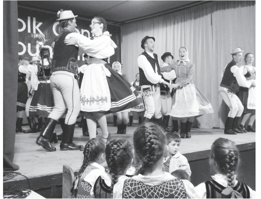
A megnyitón szokás szerint a helyiek táncolnak

verejték és a sör, hiszen ez így természetes egy egészséges nyári táborban. Napközben hagyományos népi mester-ségek, helyi kézműves-foglalkozások és falusi tevékenységek bemutatása is várja a táborozókat, látogatható lesz a falumúzeum, a Balla Antal-émlékház, és lesz fényképkiallítás és kirándulás is. Az idei táborban is főleg erdélyi és anyaországi résztvevők vannak, a szokásos kétszáz körüli létszámban, de érkeztek Európa nyugati országaiból és a tengerentúlról is. Részletes helyszíni (hangulat)jelentéssel a hét folyamán jelentkezünk.