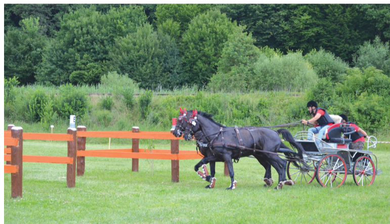
Színvonalas díjhajtást, maraton- és akadályhajtást, valamint lovasparádét is láthattak az érdeklődők az eseményen