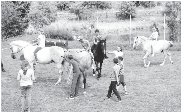
Irányítással, de önállóan dolgoztak a gyerekek, nyereg nélkül is megülik már a lovat

A péntek délutáni táborzárón a gyerekek bemutatót tartottak a héten tanultakból, oklevelet kaptak, a jelen levő szülők pedig elégedetten nyugtázták, hogy idén is hasznosan töltötték el a hetet a gyerekek.